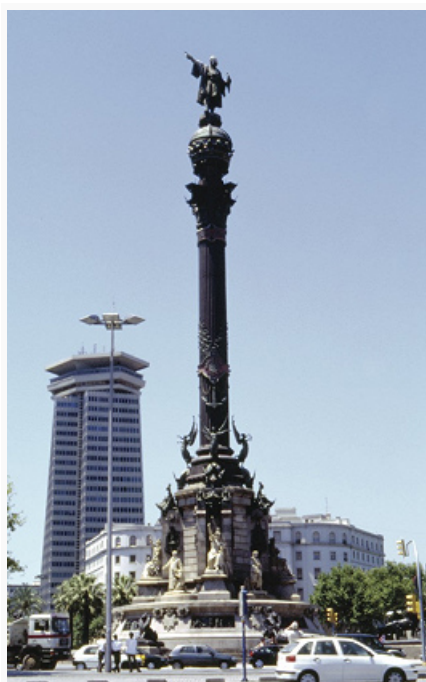
Барселона. Памятник Х. Колумбу. 1882–88.