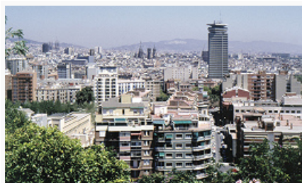
Барселона. Панорама города.