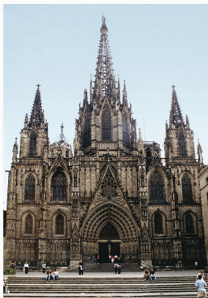
Барселона. Кафедральный собор.