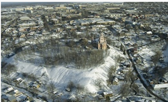
Можайск. Панорама города. Фото 2006.

Поселение на территории городища (Можайский кремль, Никольская гора) возникло в 11–12 вв., первые археологически зафиксированные укрепления возникли не позднее 13 в. Среди находок: 2 раковины каури с Мальдивских островов, биллоновые семиллопастные височные кольца, серебряные и медные браслеты, подвески, кресты-тельники и серебряная серьга, стеклянные бусы и браслеты. Наряду с ними, на территории