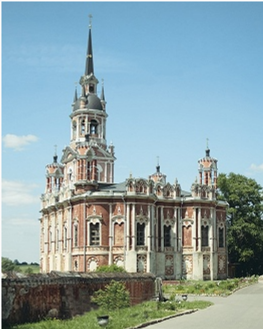
Можайск. Ново-Никольский собор. 1802–14.

1684) и одноглавая кирпичная Петропавловская церковь (Старо-Никольский собор; 1849–52, на подклете собора 14–15 вв.). У подножия холма – часовня к 100-летию Отечественной войны 1812 (1911–12). В городе с прямоугольной сетью улиц (план 1784) также сохранились: кирпичная церковь в честь Ахтырской иконы Божией Матери типа «под колоколы» (1760-е гг.; на основе белокаменного придела Св. Леонтия Ростовского, известного с 16 в.; верх перестроен в конце 18 – начале 19 вв.; в южной стене – часть стены церкви Святых Иоакима и Анны, конец 14 в., разобранной в 1867) бывшего Иоакимо-Аннинского монастыря и церковь Святых Иоакима и Анны в русском стиле (1867–71, арх. К. В. Гриневский; верх колокольни – 1892, П. Г. Егоров); здания Гостиного двора и Присутственных мест (1-я половина 19 в., перестроены), кирпичные купеческие дома конца 19 – начала 20 вв. (в т. ч. усадьба Л. В. Ролле с чертами модерна , 1898). На Брыкиной горе – Лужецкий Богородицкий Ферапонтов мужской монастырь с 5-главым собором Рождества Пресвятой Богородицы (предположительно 1520–40-е гг.; остатки росписей середины 16 в.), Святыми воротами (возможно, конец 15 в.) с надвратной Преображенской церковью (1547,