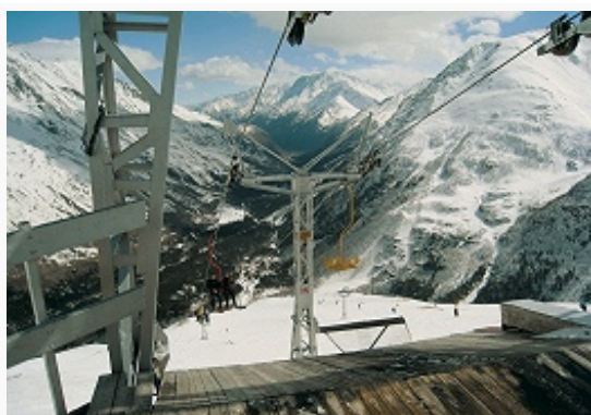
Вид на Баксанское ущелье с горы Чегет.

Оборот розничной торговли составляет 59,1 млрд. руб. (2014; рост за год на 4,7%), в расчёте на душу населения ок. 8,6 тыс. руб. (на 11,6%). Объём продаж продовольственных товаров – 27,9 млрд. руб. (рост за год на 6,3%), непродовольственных товаров – 31,2 млрд. руб. (на 3,3%). На долю торговых организаций и индивидуальных предпринимателей пришлось 80,8% оборота, розничных рынков и ярмарок – 19,2%.