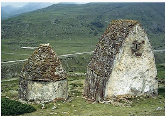
Наземные склепы-кешенеу села Верхний Чегем. 2-я пол. 18 в.

Проникновение предков кабардинцев в равнинные области началось в 14 в., о чём свидетельствуют многочисл. курганы. В горной зоне обитало местное тюркизированное население – предки балкарцев (сохранились остатки замков, боевых башен, склеповые могильники, напр. «город мёртвых» у с. Верхняя Балкария). Ко 2-й пол. 15 в. предки балкарцев окончательно локализовались в высокогорной зоне, кабардинцы – в опустевшей после походов Тимура равнинной и предгорной части территории совр. К.-Б., где образовалась Кабарда . С этого времени началось формирование К.-Б. как устойчивой области жизнедеятельности и взаимных отношений кабард. и балк. обществ на основе интеграции хозяйств. систем, феодально-иерархич. и родственных связей, общих механизмов социальной регуляции (гостеприимство, куначество, аталычество).