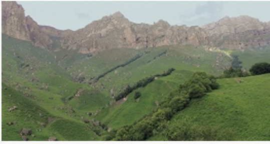
Эскарп Скалистого хребта.