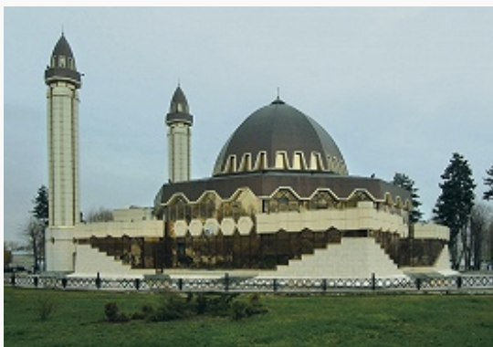
Соборная мечеть в Нальчике. 2004.