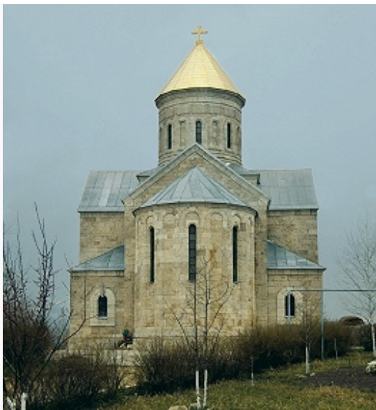
Троицкий собор Свято-Троицкого Серафимовского монастыря в селе Совхозное. 1902.