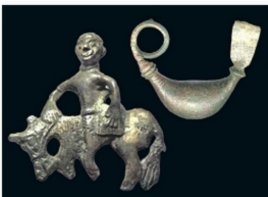
Бронзовые фигурка всадника и фибула 7–6 и 8 вв. до н. э. (по Б. Х. Атабиеву).