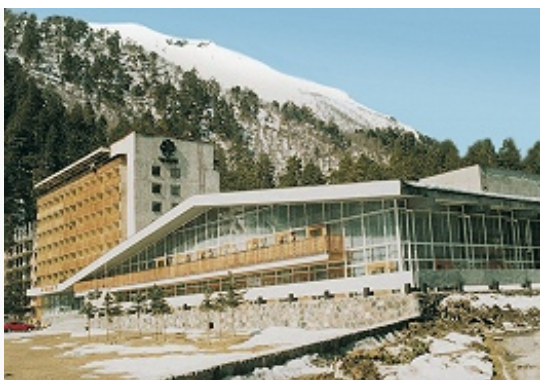
Посёлок Терскол. Гостиница «Чегет».