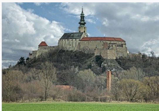
Нитра. Замок с кафедральным собором Святого Эммерама Регенсбургского. 9–18 вв.

Н. и её окрестности – один из наиболее археологически изученных регионов Словакии, чему способствовало расположение в Н. Ин-та археологии Словац. АН (с 1953). Памятники – с верхнего палеолита ( Граветт , эпиграветт). К неолиту относятся: один из крупнейших могильников линейно-ленточной керамики культуры ; поселение лужанской группы (протолендьель, см. Лендьель ) Млинаровце, где найден фрагмент медного шила (древнейшее металлич. изделие в Словакии), и др. Одна из