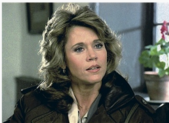
Дж. Фонда в фильме «Агнец божий». 1985.

Его дети: Джейн (р. 21.12.1937, Нью-Йорк), актриса. В 1960 окончила Актёрскую студию Л. Страсберга (Нью-Йорк). Начинала как модель и одновременно работала в театре. В кино с 1960 («Невероятная история»). Получила известность в коммерч. фильмах («Прогулка по беспутному кварталу», «Воскресенье в Нью-Йорке», «В прохладе дня», «Карусель», «Хищники»). Первая значит. драматич. роль – в социальном триллере «Погоня». В вестерне