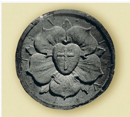
«Роза Лютера» – один из символов лютеранства, восходящий к печати, которой М. Лютер заверял свою переписку.

Ещё при жизни Лютера и особенно после его смерти среди его последователей возникли разногласия. В 1577 ок. 8000 пасторов подписали Формулу согласия, где было изложено нормативное вероучение по спорным вопросам. Она была включена в сборник лютеранских вероисповедных документов – Книгу согласия, впервые изданную в Дрездене в 1580. Кроме Аугсбургского исповедания и Формулы согласия, в неё вошли Апостольский, Никейский (с Filioque ) и Афанасиев символы веры , Апология Аугсбургского исповедания, Шмалькальденские артикулы (с приложенным трактатом «О власти и первенстве папы»), «Большой катехизис» и «Малый катехизис» Лютера. Книга согласия остаётся официальным вероучительным стандартом большинства лютеранских церквей.