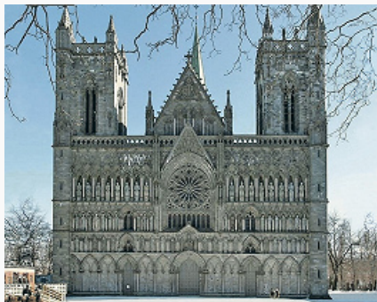
Лютеранский собор в Тронхейме (Норвегия). 12–14 вв., перестроен в 19–20 вв.

рассматриваются как сан. В 1527 лютеранская Реформация началась в Швеции (и подвластной ей Финляндии), в 1536 – в Дании, Норвегии и Исландии. Большая часть католич. епископов в этих странах перешла в Л., сохранив титул, поэтому совр. лютеранские сканд. епископы претендуют на обладание епископским саном и апостольским преемством. В результате в Л. произошло разделение на 2 осн. традиции – германскую и скандинавскую.