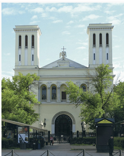
Церковь Святых Петра и Павла в С.-Петербурге. 1730.

Польского) были объединены в Евангелическо-лютеранскую церковь в России. Согласно её уставу, главой Церкви являлся рос. император. Лютеране – гл. обр. остзейские немцы – составляли значит. часть политич., воен. и культурной элиты Рос. империи. В 1914 в России, не считая Прибалтики, Финляндии и Польши, было не менее 234 лютеранских общин.