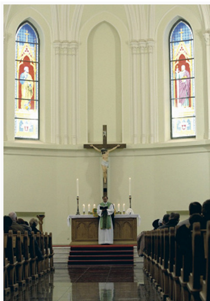
Богослужение в лютеранском храме.