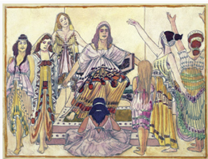
Группа к балету «Хризис» Р. М. Глиэра. Зарисовка А. А. Горского.