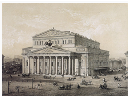
Большой театр. По рисунку В. С. Садовникова. 1859.

БОЛЬШОЙ ТЕАТР России государственный академический (ГАБТ), один из старейших театров страны (Москва). С 1919 академический. История Большого театра восходит к 1776, когда князь П. В. Урусов получил правительственную привилегию «быть содержателем всех театральных в Москве представлений» с обязательством построить каменный театр, «чтобы городу он мог служить украшением, и сверх того, дом для публичных маскарадов, комедий и опер комических». В том же году Урусов привлёк к участию в расходах выходца из Англии М. Медокса. Спектакли шли в Оперном доме на Знаменке, находившемся во владении графа Р. И. Воронцова (в летнее время – в «воксале» во владении графа А. С. Строганова «под Андрониковым монастырём»). Оперные, балетные и драматические спектакли осуществлялись силами актёров и музыкантов, вышедших из театральной труппы Московского университета, крепостных трупп Н. С. Титова и П. В. Урусова.