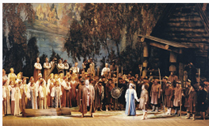
Сцена из оперы «Иван Сусанин» М. И. Глинки. Режиссёр Л. В. Баратов. Музей ГАБТ

ставился русский и европейский классический репертуар, а также оперы композиторов стран Восточной Европы – Б. Сметаны, С. Монюшко, Л. Яначека, Ф. Эркеля. С 1943 с театром связано имя режиссёра Б. А. Покровского, более 50 лет определявшего художественный уровень оперных спектаклей; эталонными считаются его постановки опер «Война и мир» (1959), «Семён Котко» (1970) и «Игрок» (1974) С. С. Прокофьева, «Руслан и Людмила» Глинки (1972), «Отелло» Дж. Верди (1978). В целом для оперного репертуара 1970-х – нач. 1980-х гг. характерно стиливое многообразие: от опер 18 в. («Юлий Цезарь» Г. Ф. Генделя, 1979; «Ифигения в Авлиде» К. В. Глюка, 1983), оперной классики 19 в. («Золото