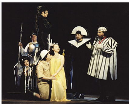
Сцена из оперы «Любовь к трём апельсинам» С. С. Прокофьева.