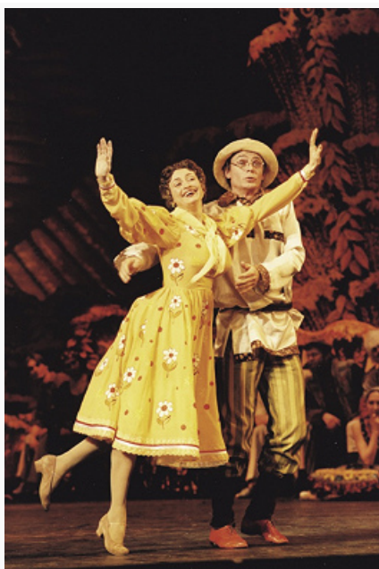
Сцена из балета «Светлый ручей» Д. Д. Шостаковича. Хореограф А. О. Ратманский. Музей ГАБТ

в летнюю ночь» на музыку Ф. Мендельсона и Д. Лигети, 2004).