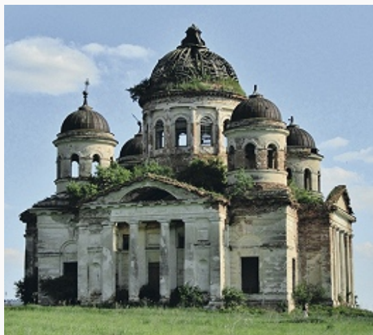
Троицкая церковь в селе Пятино. 1823–32.

Древнейшие памятники иск-ва на территории У. о. – орнаментиров. керамика (с неолита), металлич. украшения (с бронзового века). В раннем железном веке появляются городища, прикладное иск-во представлено гл. обр. изделиями ананьинской культуры , сарматских археологических культур , азелинской культуры (в т. ч. в нескольких вариантах звериного стиля и круга восточноевропейских выемчатых эмалей ). Среди памятников эпохи Великого переселения народов – бронзовый котёл с литыми украшениями, характерный для гуннов (близ с. Осока), золотые изделия «Кайбельского клада», металлич. и керамич. пластика именьковской культуры . Уникальны костяные пластины с гравированными воен. сюжетами (см. рис. к ст. Новоульяновск ), ременные гарнитурсы ср.-азиат. и визант. круга из Шиловского кургана (ок. кон. 7 в.). С 8–9 вв. доминирует иск-во, связанное с булгарами , в т. ч. с гор. культурой Булгарии Волжско-Камской [Арбужское, Кокрятьское, Красносюндюковское (в т. ч. остатки кирпичной бани 11–12 вв.), Староалейкинское городища]. Со 2-й пол. 13 в. иск-во связано с Золотой Ордой и рядом объединений кочевников.