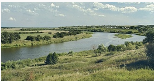
Долина реки Сура.

и солоди. В местах выходов карбонатных пород формируются перегнойно-карбонатные почвы. Леса занимают 26,3% территории области. Осн. лесообразующие породы – сосна, дуб, берёза, осина. В У. о. проходит вост. граница распространения ясеня обыкновенного и юж. граница распространения ели обыкновенной.