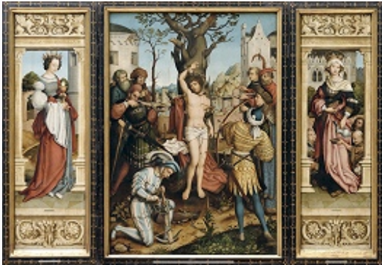
Х. Хольбейн Старший. «Алтарь Святого Себастьяна». 1515–16. Старая пинакотека (Мюнхен).

ХОЛЬБЕЙН, Гольбейн (Holbein), семья нем. живописцев и графиков эпохи Возрождения. Ханс Старший (ок. 1460/65, Аугсбург – 1524/34, Изенгейм, ныне Исенем, близ Гебвиллера, Эльзас, Франция), возможно, учился у М. Шонгауэра ; посещал Нидерланды. Работал в Аугсбурге (с 1494), Франкфурте-на-Майне (1500–01), Эльзасе (с 1509), Изенгейме (с 1516). Ранние работы отличает влияние нидерл. живописи, в т. ч. Рогира ван дер Вейдена (Алтарь доминиканского мон. в Кайсхайме,