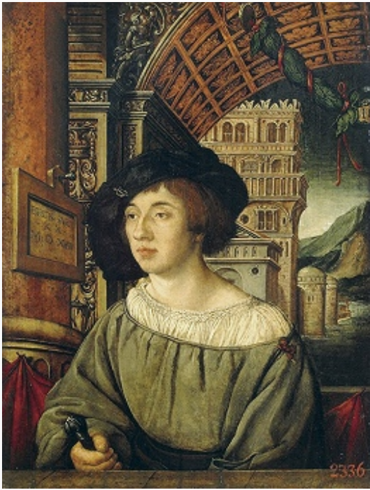
А. Хольбейн. «Портрет молодого человека». 1518. Эрмитаж (С.-Петербург).