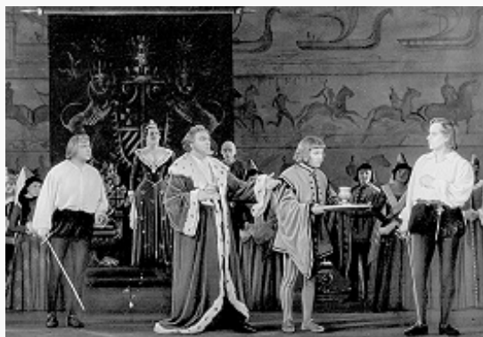
Сцена из спектакля по пьесе У. Шекспира «Гамлет» в Московском академическом театре имени Вл. Маяковского. 1955.

глубоки, чем те, деяниям которых и посвящена хроника. Так, сэр Джон Фальстаф, благодаря своей сценической популярности, после хроник («Генрих IV», ч. 1 и ч. 2; «Генрих V») перешёл в комедию «Виндзорские насмешницы» («The merry wives of Windsor», 1597–98, опубл. в 1602). В тетралогии не входят хроники «Король Иоанн» («King John», 1596, опубл. в 1623) и «Король Генрих VIII».