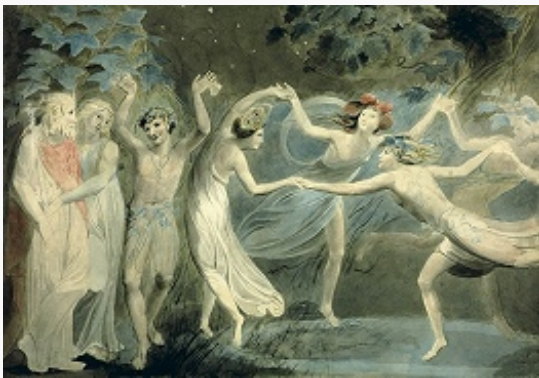
У. Блейк. «Оберон, Титания и Пак с танцующими феями». Иллюстрация к пьесе У. Шекспира «Сон в летнюю ночь». 1786. Галерея Тейт (Лондон).

С сер. 19 в. стали появляться теории, подвергавшие сомнению авторство Ш. и называвшие в качестве претендентов образованных аристократов – графов Оксфорда, Ретленда, Дерби и др. Выдвигалось предположение, что автором пьес Ш. был его предшественник К. Марло . Попытки опровергнуть авторство Ш. предпринимаются доныне, однако большинство учёных едины в своём признании его авторства.