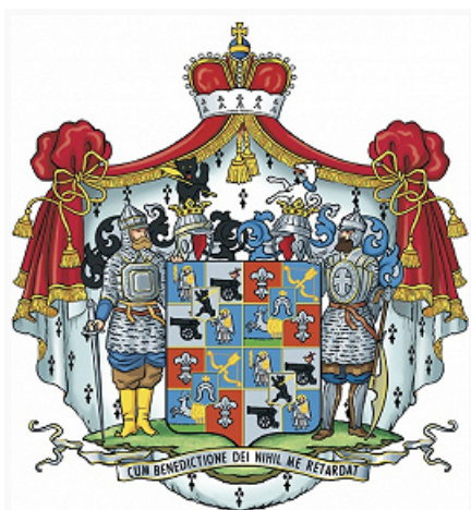
Герб князей Шаховских-Глебовых-Стрешневых. Девиз: «Cum Benedictione dei nihil me retardat»