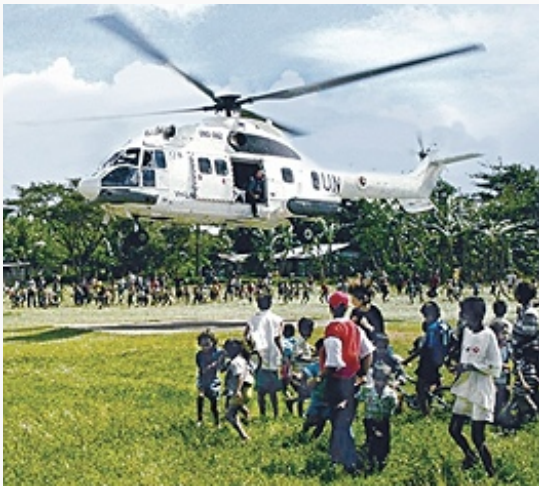
Миротворцы ООН в Лоспалосе. 1999.

Впервые остров Тимор упоминается в китайской хронике 1225 как владение яванского государства Сингасари. С 14 в. на острове существовали государственные образования, главенствующее положение среди которых занимало Вайвику-Вехали. В вассальной зависимости от него находились княжества Суай, Ликиса, Каменаса, Сервиан и др. В 14 в. Сервиан добился самостоятельности. Ок. 1520 на Тиморе обосновались португальцы. В 1613 в западной