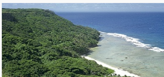
Побережье острова Тонгатапу.