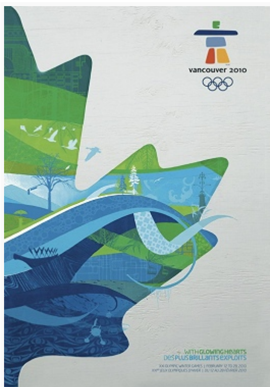
Плакат Олимпийских зимних игр в Ванкувере (2010).