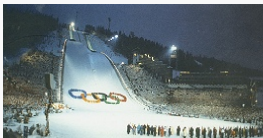
Церемония открытия Олимпийских зимних игр в Сараеве (1984).

ОЛИМПИЙСКИЕ ЗИМНИЕ ИГРЫ, комплексные соревнования по зимним видам спорта, проводимые МОК 1 раз в 4 года. Решение о регулярном проведении самостоятельных Олимпийских зимних игр принято в 1925 на Сессии МОК в Праге. Этому способствовал успех всемирных соревнований по зимним видам спорта – Международной спортивной недели по случаю