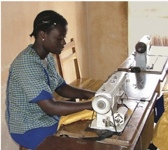
Швейная мастерская в Котону.

Б. – аграрная страна, одна из наименее развитых в мире. Объём ВВП (по паритету покупательной способности, 2015) 22,95 млрд. долл.; в расчёте на душу населения около 2,1 тыс. долл. Индекс человеческого развития 0,480 (2015; 166-е место среди 188 стран мира).