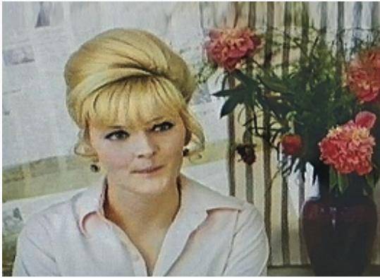
М. А. Вертинская в фильме «Семь невест ефрейтора Збруева». 1971.

ВЕРТИНСКИЕ, российские актрисы. Дочери А. Н. Вертинского и Л. В. Вертинской.