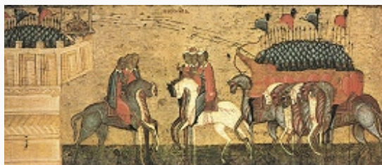
Битва новгородцев с суздальцами. Фрагмент иконы. Сер. 15 в. Третьяковская галерея (Москва).

получило широкое распространение религ. движение стригольников , а в 15 в. – «жидовствующих» .