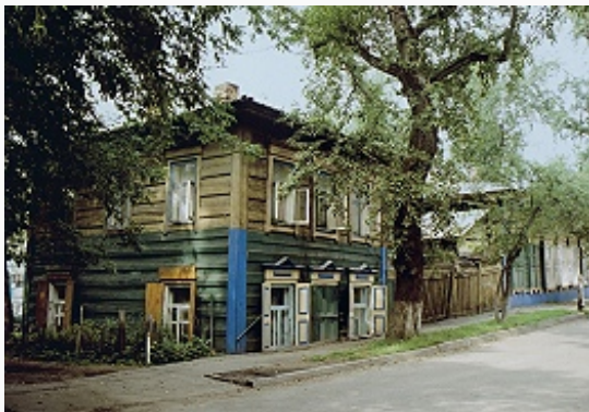
Жилая застройка старого города.

(«Белый дом»; 1800–04, проект мастерской Дж. Кваренги , в 1838–1917 ген.-губернаторский дворец, ныне Научная б-ка Иркутского гос. ун-та) и построенное в мавританском стиле здание музея Восточно-Сибирского отдела РГО (1882–83, арх. Г. В. Розен; ныне Областной краеведческий музей), с круглыми угловыми башнями. Прибрежный пейзаж И. завершает 4-пролётный Ангарский мост (1931–36, инж. П. Н. Поликарпов, арх. И. А. Француз).