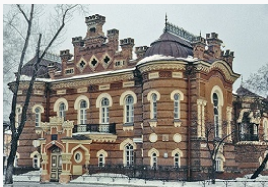
Иркутск. Здание Областного краеведческого музея. 1882–83.