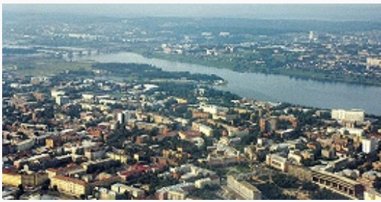
Иркутск. Панорама города.

Авторы: А. В. Дулов (история), Н. Ю. Замятина (экономика), Л. К. Масиэль Санчес, П. С. Павлинов (архитектура)