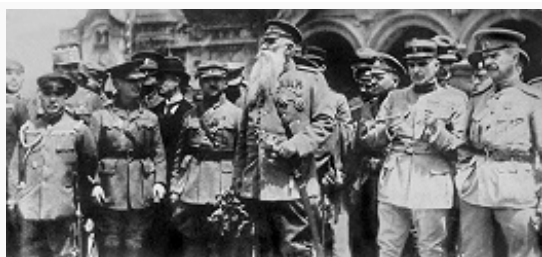
Генерал Д. Л. Хорват (в центре) и члены Международного совета, созданного интервентами. Владивосток. Май 1918.

создание независимого польск. гос-ва и др. Из-за срыва сов. делегацией во главе с Л. Д. Троцким мирных переговоров с Германией 18 февр. германские, а затем и австро-венг. войска, нарушив перемирие, начали наступление в полосе от Балтийского до Чёрного моря. За короткий срок они оккупировали Прибалтику, Украину, Крым, б. ч. Белоруссии, часть зап. и юж. районов России. Чтобы остановить герм.-австро-венг. интервенцию, СНК был вынужден 3 марта подписать Брестский мир 1918 на крайне тяжёлых условиях. С целью не допустить усиления позиций Японии на Дальнем Востоке правительство США приняло решение об усилении своего воен. присутствия в этом регионе, и 1 марта во Владивостокский порт вошёл амер. крейсер. 2 марта Мурманский совет рабочих и солдатских депутатов с согласия СНК РСФСР заключил соглашение с британо-франц. командованием, по которому командование войсками в Мурманске переходило к объединённому Воен. совету, образованному из представителей гор. властей и союзников. В марте в Мурманске высадилась брит. мор. пехота. Швед. части заняли Аландские о-ва, которые по Брестскому миру войска РСФСР должны были оставить. Правительство Великобритании 7 марта заявило о своей поддержке атамана Забайкальского казачьего войска Г. М. Семёнова .