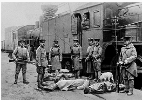
Японские интервенты у трупов убитых ими железнодорожников. 1918.

Европе маршал Ф. Фош). Планирование операций осуществлял ГШ гл. командования союзных армий. Непосредственно интервенц. войсками командовали: на севере Европ. части России – брит. ген. У. Э. Айронсайд, с сент. 1919 ген. Ф. Пуль; в Сибири – франц. ген. М. Жанен; на Дальнем Востоке – япон. ген. Отани; в Закавказье – брит. ген. Л. Денстервиль; в Туркестане – брит. ген. У. Маллесон; на Юге России – франц. ген. А. Бертело.