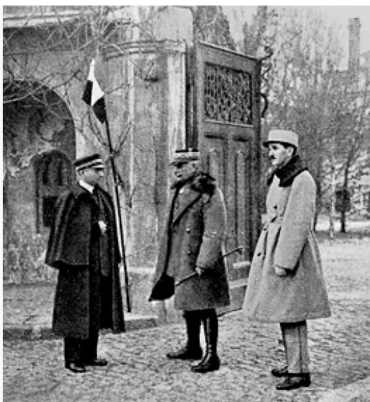
Командующий союзными войсками французский генерал Д'Ансельм (в центре) в Одессе. 1918.

мая началось Чехословацкого корпуса выступление 1918 , вскоре охватившее всю Транссибирскую магистраль . В начале июня на совещании воен. представителей Антанты в Париже было решено занять Мурманск и Архангельск силами союзных войск. На Севере началось формирование Славяно-брит. легиона (ком. – полк. К. Гендерсон). 2 июля Верховный совет Антанты решил расширить действия союзников на Севере. США 6 июля приняли решение, при условии согласия Японии, сосредоточить во Владивостоке до 7 тыс. амер. и 7 тыс. япон. военнослужащих для охраны