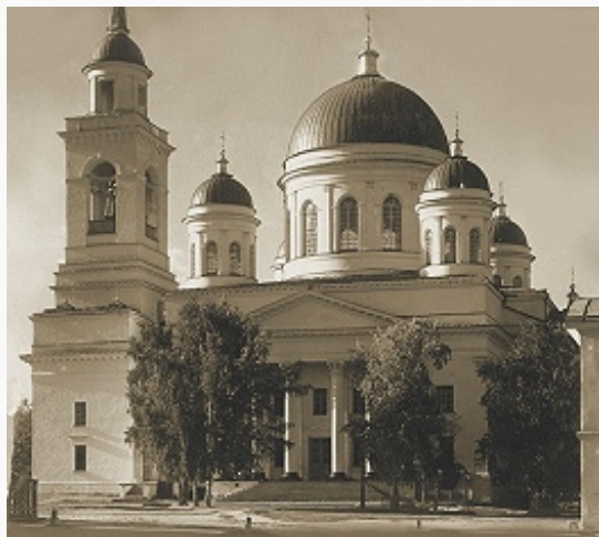
Екатеринбург. Собор Святого Александра Невского Новотихвинского монастыря. 1838–52.

Берёзовские золотые промыслы. В 1783 через Е. прошёл Большой Сибирский тракт.