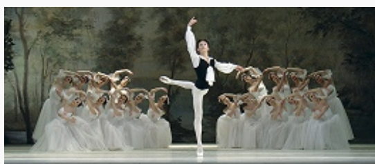
Екатеринбургский театр оперы и балета Екатеринбургский театр оперы и балета. Сцена из балета

Город с 1781. В 1781–96 Е. – центр Екатеринбургской обл., входившей в Пермское наместничество, в 1797–1919 уездный город Пермской губернии , в 1807–63 имел статус «горного города», являлся центром образованного Екатеринбургского горного окр., подчинявшегося Горному деп-ту Мин-ва финансов. Среди ремёсел Е. преобладало камнерезное и ювелирное иск-во. В 1831 в Е. переведено Пермское горное правление, а также резиденция Гл. начальника горных заводов хребта Уральского.