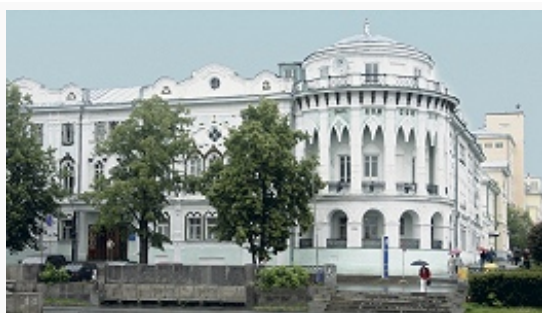
Екатеринбург. Бывший дом Н. И. Севастьянова. 1866. Архитектор А. И. Падучев.