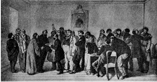
«Земские выборы». Рисунок художника К. А. Трутовского. 2-я пол. 19 в.

В З. подавляющего большинства губерний преобладало (особенно с введением в действие Земского положения 1890) дворянство. Там, где дворянское землевладение практически отсутствовало (напр., в Вятской, Вологодской, Олонецкой и Пермской губерниях), состав земских собраний был преим. крестьянским.