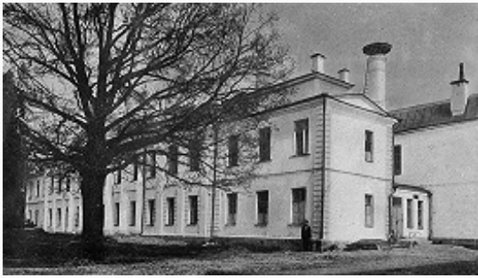
Губернская земская больница в Твери. Главный корпус. Фото. Нач. 20 в.

(первоначально небольшие), с 1908 г. стали получать субсидии на введение всеобщего начального обучения, развитие агрономич. помощи населению и др.; в 1913 они составляли 18% общего бюджета г. центр. губерний Европ. России. Кроме того, г. получали от правительства значит. целевые кредиты и пособия на строительство школ, устройство с.-х. опытных станций, борьбу с эпидемиями, открытие больниц и т. д.