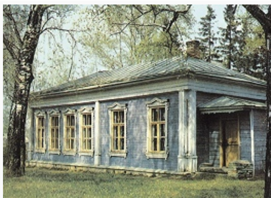
Здание земского училища в селе Мелихово Серпуховского уезда Московской губернии. 1995.

Новгородским (1869), Московским и Казанским (1871) губернскими З. Всего в 1869–73 З. учредили 12 учительских семинарий. В 1870-х гг. З. 16 губерний выплачивали пособия учительским семинариям Мин-ва нар. просвещения. З. содержали своих стипендиатов в гос. учительских семинариях. С целью повышения проф. подготовки учителей З. устраивали для них педагогич. курсы, созывали съезды учителей (в 1885 – кон. 1890-х гг. не созывались из-за запрета правительства). Постепенно З. расширяли своё участие в содержании школ, обеспечивали их учебными пособиями, некоторые З. оплачивали завтраки учащихся, приобретали для них тёплую одежду и обувь. В сер. 1890-х гг. З. развили активную деятельность по строительству, а также капитальному ремонту школьных зданий, в 1908, используя целевые субсидии правительства, приступили к полному освобождению сельских обществ от расходов на содержание школ.