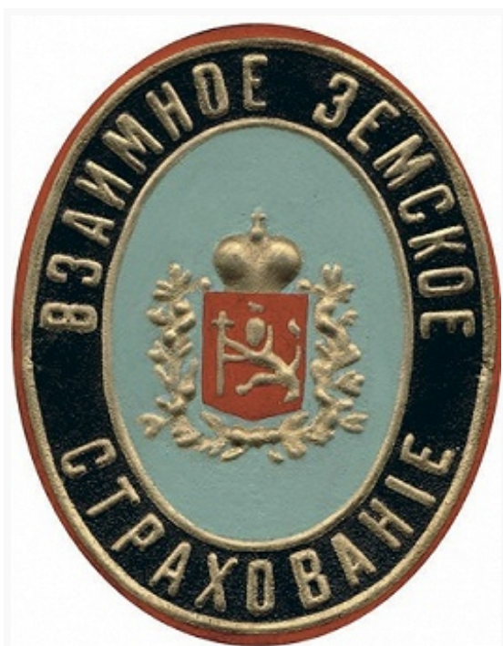
Музей истории российского страхования

В сфере общественного призрения З. занимались делами, ранее подведомственными приказам общественного призрения . губернские З. содержали заведения для душевнобольных (в 1908 в них лечились ок. 48 тыс. чел.), дома сирот и школы для них, госпитали, богадельни. З. устраивали приюты для подкидышей и слепых, детские ясли на период полевых работ, ночлежные дома при школах для детей из удалённых селений. Большое внимание этой работе уделяли З. Нижегородской и Костромской губерний. З. также оказывали единовременную помощь населению, пострадавшему в результате стихийных бедствий. В 1-ю мировую войну призрение сирот, оказание помощи инвалидам, беженцам и семьям фронтовиков стало одним из гл. направлений работы земств.