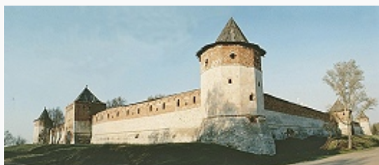
Зарайский кремль. 1527 (или 1528)–1531.

Один из немногих в России полностью сохранившихся кремлей – прямоугольная в плане кирпичная крепость, частично облицованная белым камнем, с четырьмя многогранными угловыми и тремя 4-угольными проездными башнями; стены завершались трёхгорбыми, редкого типа зубцами (в 1650–51 при ремонте крепости арх. Б. Августовым преобразованы в аркатуру). В нём расположены 5-главый бесстолпный Никольский собор (1681; историч. формы восстановлены в 1959–61 под рук. арх. Г. П. Белова; на главах прорезные кресты 17 в.) и необарочный собор Иоанна Предтечи (1901–04, арх. К. М. Быковский ), а также здание гор. магистрата (нач. 19 в.). На территории кремля обнаружены археологич. материалы 12–17 вв., исследовалась Зарайская стоянка .