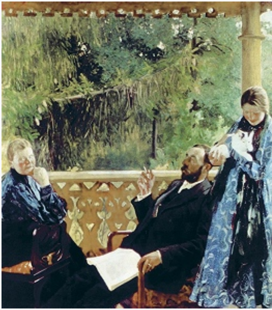
Б. М. Кустодиев. Портрет семьи Поленовых («Семейный портрет»). 1904–05. Художественно-исторический музей (Вена).

словаре Ф. А. Брокгауза и И. А. Ефрона» раздел геологии и палеонтологии (автор св. 200 статей). Чл. Геологич. части при Кабинете Е. И. В. (с 1894). В 1882 (совм. с Н. А. Соколовым) и в 1894–1911 участвовал в геологич. экспедициях по Алтаю, в 1883–86 проводил петрографич. исследования на дачах Нижнетагильского, Нижнесалдинского и Алапаевского заводов на Урале, в 1887 геологич. исследования в бассейне р. Юг в Устюжском у., в 1888–89 геолого-почвенные изыскания в Хорольском и Константиноградском уездах Полтавской губ., в 1891 обследовал окрестности С.-Петербурга и долину р. Нева, в 1892–93 открыл и исследовал новые месторождения золота в Северо-