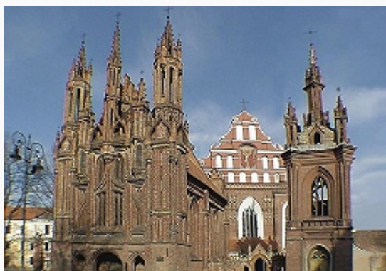
Вильнюс. Костёл Святой Анны

В 13–14 вв. близ устья р. Вильня заложен комплекс укреплений В., состоявший из трёх замков: Верхнего (Гедимино; 14–15 вв.; сохранилась зап. башня, остатки жилого дворца, обводных стен и въездных ворот), Нижнего [сохранились: Старый арсенал, 15 в.; Новый арсенал, 15 – сер. 16 вв., ныне здание Нац. музея Литвы; кафедральный собор на центральной пл. Гедиминаса (Гедимино), основан в 1387, перестроен в 1783–1801, архитекторы Л. Стуока-Гуцявичюс, М. Шульц] и Кривого (сожжён крестоносцами в 1390; ныне территория Нагорного парка). Архит. ансамбли: сформированный костёлами Св. Анны (Онос, 15–18 вв.; фасад в стиле кирпичной готики , 16 в.), Св. Михаила (1594–1625; сочетание черт