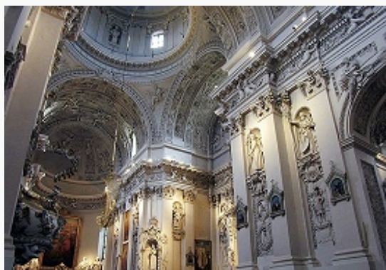
Вильнюс. Костёл Святых Петра и Павла. Интерьер. 1677–1704.

В 1922 решением польск. Сейма включён в состав Польши (решение не признано Литвой и РСФСР). В сент. 1939 занят Красной Армией и 10.10.1939 передан СССР Литве. В 1940 официально переименован в В. С 21.7.1940 столица Литов. ССР. 23.6.1941 оккупирован герм. войсками; в годы 2-й мировой войны сильно разрушен (уничтожено ок. 40% зданий); убито более 200 тыс. евреев, содержащихся гитлеровцами в вильнюсском гетто. 13.7.1944 освобождён Красной Армией. 11.3.1990 в В. провозглашён Акт о независимости Литвы, с 6.9.1991 столица Литов. Республики.