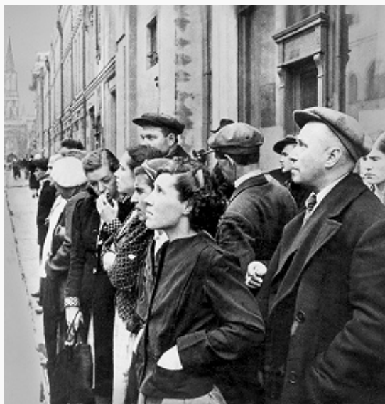
Москвичи слушают выступление по радио В. М. Молотова.

Сов. правительство и ЦК ВКП(б) приняли ряд чрезвычайных мер по мобилизации всех ресурсов государства для отражения агрессии, перестройке жизни и деятельности страны на воен. лад. Президиум ВС СССР объявил о мобилизации военнообязанных 1905–18 годов рождения. На базе управлений и войск приграничных воен. округов были созданы Сев., Сев.-Зап., Зап., Юго-Зап. и Юж. фронты (в дальнейшем создавались др. фронты, их число изменялось). Мор. рубежи защищали Сев., Балт. и Черномор. флоты. Для стратегич. руководства вооруж. силами 23 июня создана Ставка Главного командования (см. Ставка Верховного Главного командования ). Её рабочим органом стал Генеральный штаб . Исходя из сложившейся обстановки, сов. командование в конце июня приняло решение о переходе на всём сов.-герм. фронте к стратегич. обороне. Перед войсками 1-го стратегич. эшелона была поставлена задача – подготовить на направлениях гл. ударов противника систему эшелонированных оборонит. полос и рубежей, опираясь на них, остановить его и выиграть время для подготовки контрнаступления. В