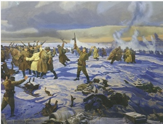
«Сталинградская битва. Соединение фронтов». Художники М. И. Самсонов и А. М. Самсонов.

состоявшаяся 29.9–1.10.1941 (см. Московские совещания 1941–43 ). В мае – июне 1942 в ходе переговоров между СССР, США и Великобританией было достигнуто решение о создании второго фронта в Европе в 1942.