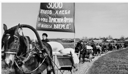
Обоз с хлебом колхоза «Вперёд» в фонд Красной Армии. Ярославская область. 1944.

5,4 тыс. танков и штурмовых орудий и св. 3 тыс. самолётов. Общая воен.-политич. и стратегич. обстановка в сравнении с первыми годами войны изменилась в пользу СССР и его вооружённых сил. В 1944 в СССР произ-во стали составило 10,9 млн. т, чугуна – 7,3 млн. т, каменного угля – 121,5 млн. т, нефти – 18,3 млн. т. В 1942–44 было построено в вост. районах св. 2,2 тыс. крупных пром. предприятий и восстановлено в освобождённых районах св. 6 тыс. предприятий. В 1944 восстановлено св. 24 тыс. км железных дорог. Оборонная пром-сть в 1944 ежемесячно производила танков и самолётов в 5 раз больше, чем в 1941, достигнув макс. уровня за время войны. С. х-во добилось увеличения произ-ва хлеба, животноводч. продукции, в 1944 посевные площади страны увеличились по сравнению с 1943 на 16 млн. га. К нач. 1944 в действующей армии СССР было св. 6,3 млн. чел., св. 83,6 тыс. орудий и миномётов (без зенитных орудий и 50-мм миномётов), ок. 5,3 тыс. танков и САУ, 10,2 тыс. боевых самолётов. Однако подавляющего превосходства над герм. войсками в силах и средствах (за исключением артиллерии и авиации) ещё не было. Противник удерживал в своих руках ряд сов. воен.-мор. баз, вследствие чего возможности базирования и операций Балт. и Черноморского флотов были ограничены. Перед Красной Армией стояла задача завершить освобождение от захватчиков сов. земли, оказать помощь народам Европы в освобождении от герм. оккупации, закончить войну разгромом врага на территории Германии.