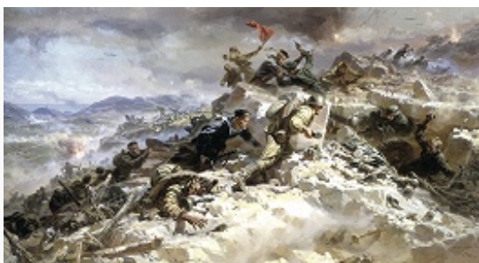
«Штурм Сапун-горы 7 мая 1944 года». Художник П. Т. Мальцев. Фрагмент диорамы. 1959.

предгорья Карпат и на территорию Румынии. В результате Ленинградско-Новгородской операции 1944 была окончательно снята блокада Ленинграда. Весной 1944 освобождён Крым. В соответствии с решениями Тегеранской конференции вооруж. силы США и Великобритании 6.6.1944 начали вторжение в Сев. Францию (см. «Оверлорд» операция ). Высадке союзников в Нормандии