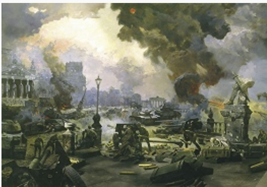
«Штурм Берлина». Художник В. М. Сибирский.

С открытием второго фронта положение Германии ухудшилось. Зажатая в тисках двух фронтов, она уже не могла свободно перебрасывать силы с Запада на Восток, ей пришлось проводить новую тотальную мобилизацию, чтобы в какой-то мере восполнить потери на фронте. В то же время наметилась координация воен. действий сов. войск с вооруж. силами союзников. Зимой 1944/45, когда в результате наступления герм.