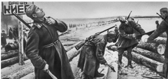
Битва за Днепр. Подготовка деталей моста. 1943.

фронта и одновременно улучшить стратегич. положение под Москвой и Ленинградом. 19.11.1942 началось контрнаступление сов. войск под Сталинградом, в ходе которого были окружены 22 дивизии и 160 отд. частей герм. войск (330 тыс. чел.). Стратегич. инициатива окончательно перешла к Красной Армии.