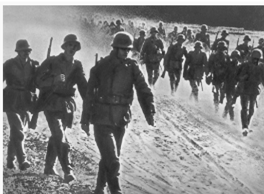
Вторжение германских войск на территорию СССР. 1941.

Вост. Пруссии, получила задачу разгромить сов. войска в Прибалтике и захватить порты на Балтийском м., включая Ленинград и Кронштадт. Группа армий «Центр», сосредоточенная на гл. (московском) направлении, должна была расцеч стратегич. фронт обороны, окружить и уничтожить войска РККА в Белоруссии и развивать наступление на Москву. На киевском направлении была развёрнута группа армий «Юг», имевшая задачу уничтожить сов. войска на Правобережной Украине, выйти на Днепр и развивать наступление на восток. На территории Норвегии и в Финляндии были развёрнуты герм. армия «Норвегия» и 2 финские армии. Армия «Норвегия» имела задачу овладеть Мурманском и Полярным, финские войска – содействовать группе армий «Север» в захвате Ленинграда. В резерве гл. командования сухопутных войск Германии находилось 24 дивизии. В войне против СССР руководители Германии планировали поработить и физически истребить миллионы сов. людей, что предусматривалось генеральным планом «Ост» , осуществлять безжалостную эксплуатацию уцелевшего населения, природных и производств. ресурсов захваченных территорий. Поскольку с февр. 1941 герм. войска сосредоточивались у зап. границ СССР, в мае для доукомплектования ряда соединений РККА были призваны на учебные сборы 800 тыс. резервистов, началось выдвижение войск из внутр. округов на запад. Однако к 22.6.1941 Красная Армия не успела завершить мобилизац. мероприятия и полное развёртывание по плану прикрытия гос. границы.