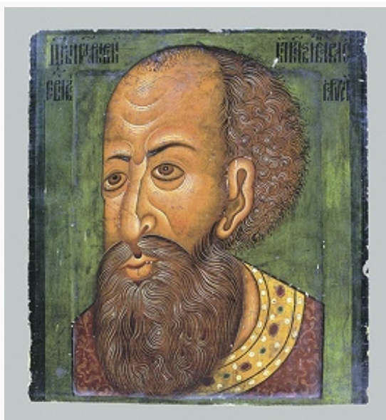
«Иван IV Васильевич». Парсуна. 1630-е гг. Национальный музей

Некоторая стабилизация внутр. положения, длительное бескоролье в Речи Посполитой (1572–76, с небольшим перерывом в 1574), отсутствие масштабных набегов на юге (при этом в 1572–1574 произошло крупное восстание местного населения в Ср. Поволжье) позволили И. IV В. активизировать действия на театре Ливонской войны, где в 1572–77 был проведён ряд успешных операций, не принёсших, однако, решительной победы.