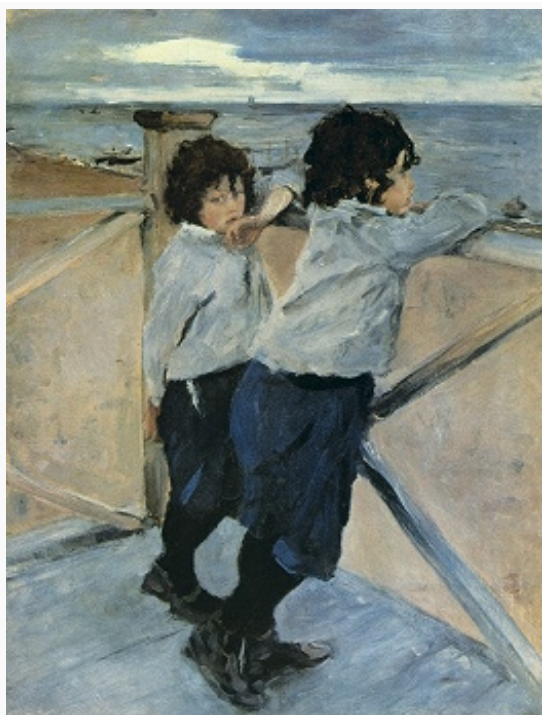
В. А. Серов. «Дети». 1899. Русский музей (С.-Петербург).

создал много заказных портретов, в которых нередко прибегал к «апробированным» приёмам европ. парадного портрета, сочетая эффектность композиции с унаследованной от И. Е. Репина глубиной проникновения во внутр. мир модели. Среди них – портреты вел. кн. Павла Александровича (1897), имп. Николая II (1900, оба – в ГТГ) и др. членов имп. семьи; С. М. Боткиной (1899), кн. З. Н. Юсуповой (1902; см. илл. к ст. Одежда ), кн. Ф. Ф. Юсупова, графа Сумарокова-Эльстона и его сыновей – Н. Ф. и Ф. Ф. Юсуповых (все 1903; все – в ГРМ). Поздние портреты С. исполнены в стилистике, близкой модерну , – Г. Л. Гиршман (1907, ГТГ), И. А. Морозова (1910, там же; см. илл. к статье о нём), балерины И. Л. Рубинштейн (темпера, уголь, 1910, ГРМ), В. О. Гиршмана (1911, ГТГ), кн. О. К. Орловой (1911, ГРМ; см. илл. к ст. Живопись ).