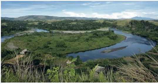
Ландшафт острова Гуадалканал.

наибольшее их количество выпадает с декабря по март. Характерна высокая относит. влажность воздуха (до 90%). В летний период наиболее вероятны ураганы. Реки короткие, многоводные. В растит. покрове – влажные вечнозелёные леса (пальмы, фикусы и др.), в наиболее сухих местах – саванны. По берегам – мангровая растительность. В фауне