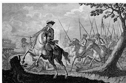
«Казачи преследуют прусского короля Фридриха II под Кунерсдорфом в 1759». Гравюра П. Хаса по рисунку Б. Роде. 1793.

К началу кампании 1758 численность армий антипрусской коалиции составила ок. 320 тыс. чел., в то время как прус. армия (вместе с союзниками) насчитывала всего 145 тыс. чел. Воспользовавшись отвлечением корпуса Х. фон Левальда действиями против шведов, рос. армия неожиданно для противника в конце дек. 1757 вновь перешла в наступление. К концу янв. 1758 рос. войска овладели всей Вост. Пруссией. Фридрих II начал кампанию 1758 с нанесения удара по французам. Действуя двумя группировками (по 30–40 тыс. чел.; герцог Фердинанд Брауншвейгский и принц Генрих Прусский, брат Фридриха II), прус. армия в феврале перешла в наступление против франц. армии маршала Л. Ришельё, сменившего д'Эстре. Под натиском противника