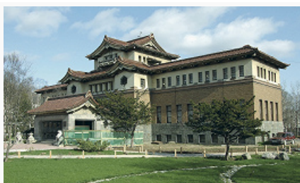
Здание краеведческого музея в Южно-Сахалинске. 1935–37. Архитектор Ёсио Кайдзуки.

Древние предметы иск-ва С. о. – орнаментированная керамика (с палеолита), костяные украшения и фигурки охотской культуры (7–16 вв.), металлич. украшения чжурчжэней , предметы народного иск-ва (в т. ч. ритуальные) айнов , нивхов , эвенков , ороков ( уйльта ). Наиболее древние памятники архитектуры – остатки кит. крепостных сооружений времени династии Юань (1279–1368), айнские городища на юге Сахалина. С 18 в. строились православные церкви на сев. Курильских о-вах (Свт. Николая на о. Шумшу, 1756, и др., все – не сохр.), с кон. 18 в. – япон. торговые фактории на Сахалине и др. островах; с 1850-х гг. – рус. военные укрепления (Пост Муравьёвский, 1853; Пост Дуэ, 1856; и др.), здания каторжных тюрем (Александровская, Корсаковская и др.; все – не сохр.).