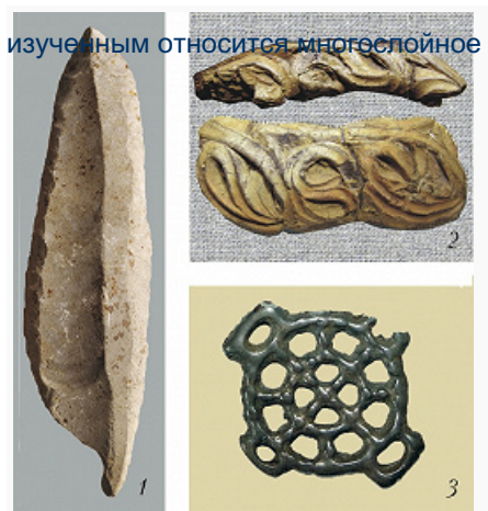
Археологические находки из Сахалинской области: 1 – базальтовый нож на микропластине, Огоньки-5, поздний палеолит; 2 – фрагмент керамического сосуда (виды сверху и анфас), Седых-1, поздний...

изученным относится многослойное поселение Огоньки 5 (21–13 тыс. лет назад) в бассейне р. Лютога: жилища типа чума с земляными полами, ямными очагами, рабочими площадками; преобладают орудия на пластинах, в осн. с торцовых и клиновидных нуклеусов, микропластинки 10× 1,5–2 мм служили для особо точных операций.