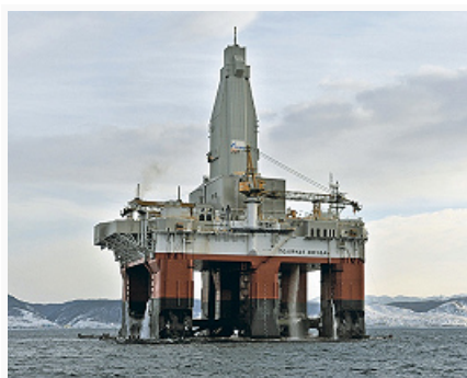
Добыча природного газа на Киринском месторождении.

Отраслевая структура обрабатывающих производств (%): пищевкусовая пром-сть 60,0, произ-во нефтепродуктов, химич. пром-сть 15,0, машиностроение 9,5, произ-во строит. материалов 6,0, металлургич. произ-во, выпуск готовых металлоизделий 5,3, деревообработка, целлюлозно-бумажная и полиграфич. пром-сть 2,4, др. отрасли 1,8.