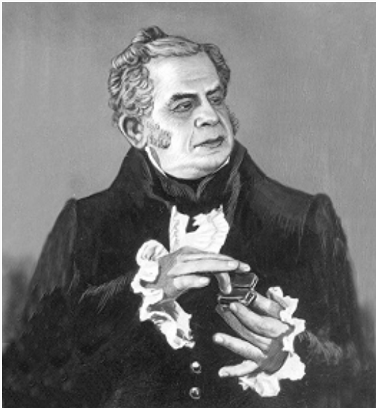
П. М. Садовский (младший) в роли Фамусова («Горе от ума» А. С. Грибоедова).

Сочность красок, тонкий юмор и жизнерадостность сочетала с естественностью исполнения. В то же время умела передать глубокий драматизм, в некоторых ролях поднимаясь до подлинного трагизма: Анфуса Тихоновна («Волки и овцы»), Глафира Фирсовна («Последняя жертва»), Кукушкина («Доходное место»), Феклуша и Кабаниха («Гроза»), графиня Хрюмина и княгиня Тугоуховская («Горе от ума» А. С. Грибоедова), Захаровна («Старик» М. Горького). К. С. Станиславский называл С. «драгоценным алмазом русского театра».