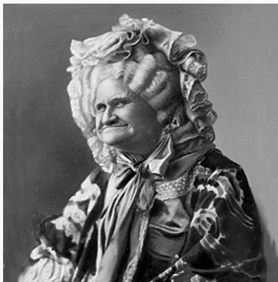
О. О. Садовская в роли графини Хрюминой («Горе от ума» А. С. Грибоедова).

Его сын Михаил Провович [12(24).11.1847, Москва – 26.7(8.8). 1910, там же]. Подготовленный к сцене отцом и А. Н. Островским, в 1869 дебютировал в Малом театре, в 1870 принят в труппу на амплуа «бытового простака» и «характерного комика». Первый исполнитель ролей в пьесах Островского: Буланов («Лес»), Мурзавецкий («Волки и овцы»), Карандышев («Бесприданница»), Мелузов («Таланты и поклонники») и др. По желанию драматурга ему передавались роли в возобновлённых спектаклях: Тихон («Гроза»), Счастливец («Лес»), Хлынов («Горячее сердце»). Знарок быта старой Москвы, в совершенстве владел сценич. речью, его искусство отличалось жизненной правдивостью, благородной простотой и одновременно драматизмом, сатирич. остротой: Хлестаков («Ревизор» Н. В. Гоголя), Пётр («Власть тьмы» Л. Н. Толстого), Мисаил и Лепорелло («Борис Годунов» и «Каменный гость» А. С. Пушкина), Беспандин («Завтрак у предводителя» И. С. Тургенева). Автор пьесы «Душа – потёмки» (1885). Преподавал в Музыкально-драматич. уч-ще Моск. филармонич. об-ва и на драматич. курсах Моск. театрального уч-ща.