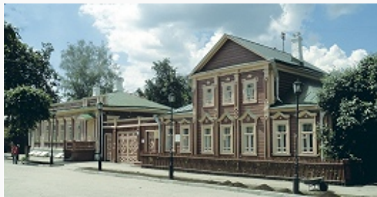
Рязань. Мемориальный музей- усадьба академика И. П. Павлова.

Историко-архит. музей-заповедник (1884, совр. назв. с 1968), Гос. областной худож.