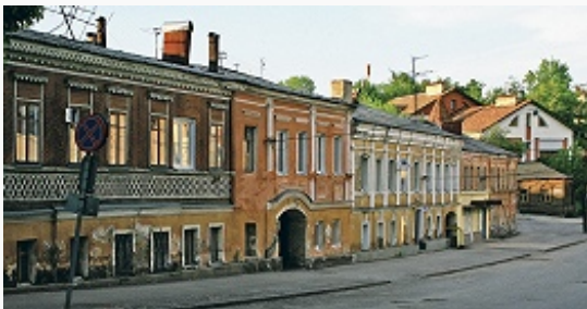
Рязань. Старая застройка.

Рождества Христова (1598–1606, перестроен в 1826 и 1873) и колокольня (1-й ярус, 1789–97, арх. С. А. Воротилов; 2-й ярус, 1816, арх. И. Ф. Руска; верх – 1836–40, архитекторы А. А. Тон, Н. И. Воронихин); 2-шатровая ц. Сошествия Св. Духа (1642, Зубов) быв. Духова мон. (упоминается с 1505, выведен из кремля в 1783), Консисторский и Певческий (1658) корпуса, амбары (кон. 17 в., арх. Н. Устинов); окружённый стенами (1757) Спасский мон. (упоминается с сер. 15 в., упразднён в 1920, возобновлён в 2005) с бесстолпным Спасо-Преображенским собором (завершён в 1702), 5-главой Богоявленской ц. с шатровой колокольней (между 1638 и 1647, подклет 16 в.) и т. н. Гостиницей знати (17–19 вв.; ц. Св. Иоанна Богослова, 1904).