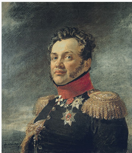
Н. Г. Репнин (до 1801 Волконский). Портрет работы мастерской Дж. Дюу. 1822–26. Эрмитаж (Военная галерея Зимнего дворца, С.-Петербург).