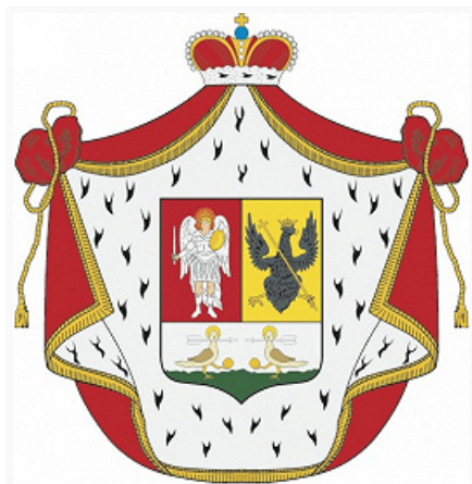
Герб рода князей Репниных.

РЕПНИНЫ́, рус. княжеский род, Рюриковичи , отрасль князей Оболенских .