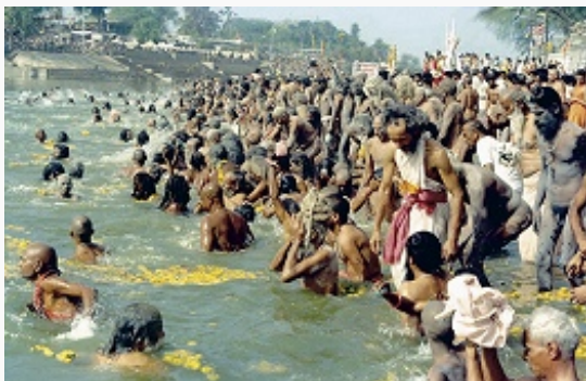
Кульминация Кумбха Мелы. 1992. Омовение в реке Сипра (город Удджайн, штат Мадхья-Прадеш).

самым получивший способность очищать других. В паломничество следует отправляться пешком и босиком (для пожилых и немощных допускаются послабления). Общеиндийскими центрами паломничества считаются Айодхья, Матхура, Дварка, Варанаси, Рамешварам, Удджайн, помимо них есть центры, популярные в отдельных направлениях индуизма.