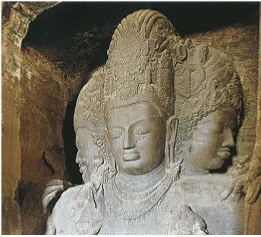
Статуя Шивы в пещерном храмене о. Элефанта. Три головы олицетворяют функции создателя, хранителя и разрушителя Вселенной. 8 вв.