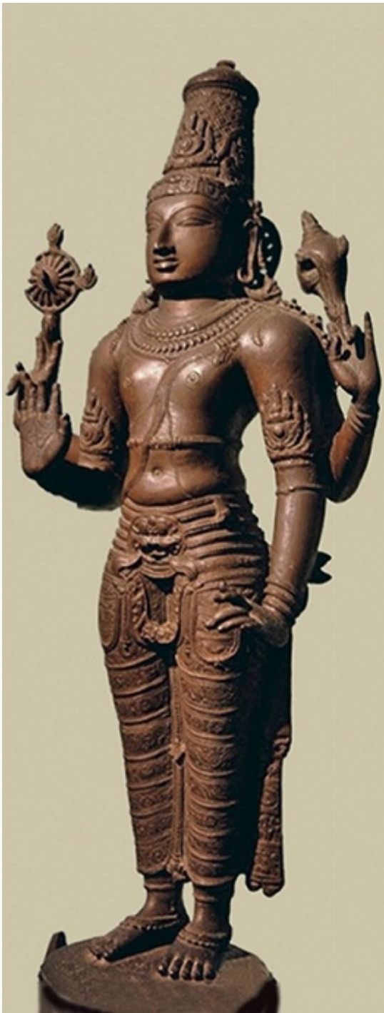
Вишну. Эпоха поздней Чолы. 12 в. Южная Индия. Национальный музей (Нью-Дели).

В повседневной жизни индуиста бог выступает как помощник и покровитель, обеспечивающий благоденствие. Верующий, вознося молитвы осн. богу той ветви И., к которой он принадлежит по рождению, не забывает других богов. Существуют боги, любимые практически всеми индуистами: играющий роль посредника между людьми и богами слоголовый сын Шивы Ганеша , прославленные герои «Рамаяны» Рама и Хануман. Часто боги отвечают за отд. стороны жизнедеятельности человека; напр., к Ганеше обращаются ради успеха начинания или в начале путешествия, богиня Лакшми сопутствует накоплению богатства, Индру просят о своевременных дождях и хорошем урожае.