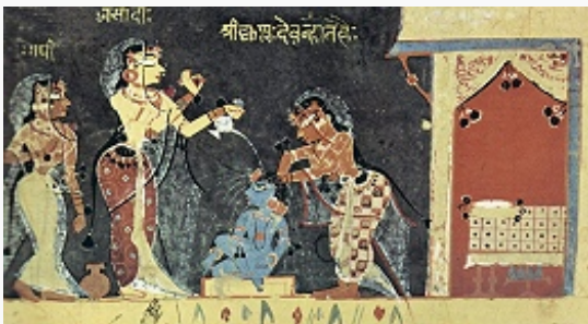
Купание младенца-Кришны. Иллюминированная рукопись «Бхагавата-пураны». Ок. 1500. Мумбаи.

мифологией; по мере формирования культ Вишну впитывал в себя культы др. богов, с которыми он отождествлялся (Нараяна, Санкаршана, Васудева). Важным этапом становления вишнуизма стала религ.-филос. поэма «Бхагавадгита» (букв. – «Песнь Господа»), входящая в 6-ю кн. «Махабхараты». Один из героев этой поэмы, бог Кришна, наставляет кшатрия Арджуну на путь бхакти – служения богу на основе любви и всепоглощающей личной преданности. Этот путь провозглашается наивысшим и наиболее эффективным способом освобождения от сансары.