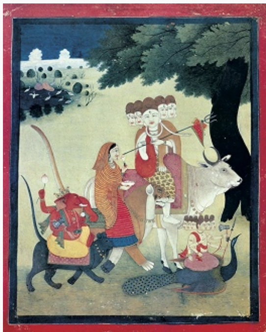
«Святое семейство» шиваизма: Шива, Парвати, Ганеша, Муруган. Музей Ритберг (Цюрих).

В теистич. течениях И., таких как вишнуизм и шиваизм, концепция безатрибутного