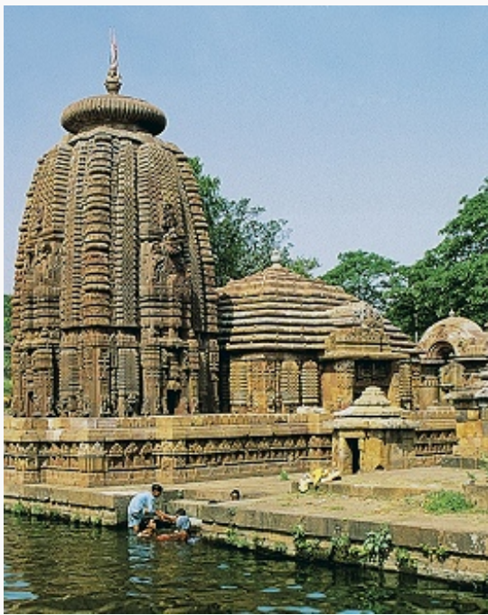
Храм Муктешвара (ок. 950) в городе Бхубанешвар (штат Орисса).

проводятся дома, обычно в присутствии приглашённых и с помощью брахмана. Существует и множество др. домашних обрядов, совершаемых с целью устранения влияния вредоносных сил и привлечения богов на свою сторону. Среди совр. индуистов лишь немногие выполняют все предписания и обряды (только для утренних обрядов нужно не менее трёх часов), в осн. это старые брахманы и брахманские вдовы.