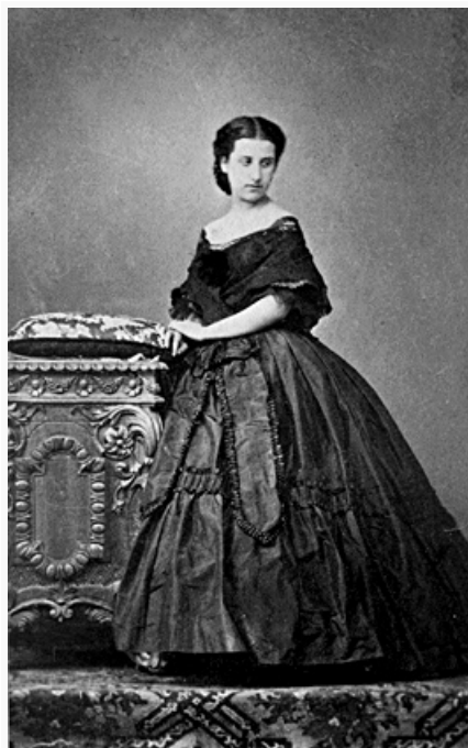
М. Э. Мещерская. Фото. 1860-е гг.

Его сын – Григорий Семёнович (?–1772), ген.-поручик (1760), чл. Воен. коллегии (с 1760), губернатор Новгородской губ. (1760–61), комендант крепости Св. Елизаветы (1762). Потомок К. Б. Мещерского в 11-м поколении – Алексей Павлович [5(16).2.1797–21.1(2.2).1858], майор (1827), писатель, автор книг «Записки русского путешественника: Голландия, Бельгия и Нижний Рейн» (1842), «Очерки берегов Рейна и Швейцарии» (1844).