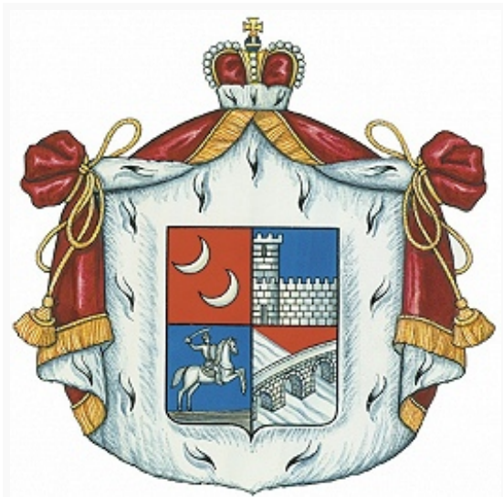
Герб рода князей Мещерских.

МЕЩЕРСКИЕ, рос. княжеский род татарского происхождения. Согласно «Государеву родословцу» (1555–56) и «Бархатной книге» , ведёт начало от кн. Уссейна, принадлежавшего, возможно, к знатному крымско-тат. роду Ширинов. Сын Уссейна кн. Бахмет в кон. 13 в. завоевал часть Мещеры и основал там полунезависимое княжество. Во 2-й пол. 15 в. представители рода влились в состав служилого сословия Рус. гос-ва. Они были испомещены в разл. частях страны, в частности в Каширском у.