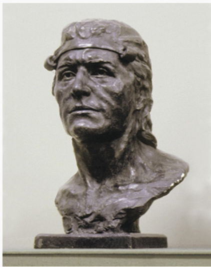
Голова мужчины (Пепкинский курган, Республика Марий Эл). Реконструкция Г. В. Лебединской. Лаборатория антропологической реконструкции Института этнологии и антропологии РАН.

подвески, пронизки и др. Среди костяных изделий – псалии с монолитными и вставными шипами, пряжки, навершия-лопаточки и др.