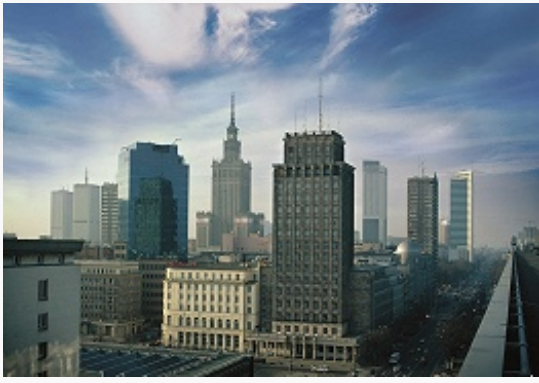
Варшава. Панорама современной части центра города.

Польша (Центральный банк; 1945), Варшавская фондовая биржа (1991; единственная в Польше, крупнейшая в Центральной и Восточной Европе), штаб-квартиры 40 из 100 ведущих промышленных компаний страны («Polskie Górnictwo Naftowe i Gazownictwo», PGNiG – нефтяная и газовая промышленность; «Polska Grupa Energetyczna», PGE – электроэнергетика; «Polski Holding Obronny»,