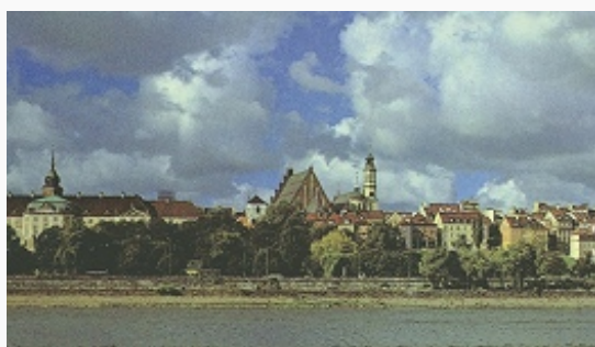
Вид Варшавы со стороны района Прага.

Значительную часть площади города занимают леса, парки и водные объекты. На высоком левом берегу Вислы расположено историческое ядро В. – районы Старе-Място и Нове-Място с центральной площадью Рынок в каждом. В Старе-Място с прямоугольной планировкой: крепостные стены (14–15 вв.) с предвратным укреплением – «барбаканом» (1548, архитектор Дж. Баттиста ди Венеция), дома 15–18 вв. с декоративной скульптурой и сграффито, готический зальный костёл Св. Иоанна Крестителя (14–16 вв.), костёлы Св. Мартина (1356, готическая башня – 15 в., барочный фасад – 1744), иезуитов (1609–26); на Замковой площади – Королевский замок (1599–1619; на месте готического замка 14 в.; разрушен в 1939–44; восстановлен в 1970-е гг.), колонна