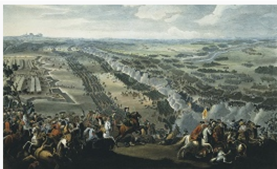
Полтавская битва 1709. Гравюра Ш. Симоно с оригинала П. Д. Мартена Младшего. 1720-е гг.

Первая фаза П. б. (с 4 до 9 ч). Для отвлечения внимания рос. командования от направления гл. удара нерегулярный конный Валашский полк (не более 1 тыс. чел.) атаковал с юга рос. войска близ ретраншемента. Одновременно осн. силы швед. армии [ок. 8,2 тыс. чел. пехоты, 7,8 тыс. чел. кавалерии; 4 орудия; командующие – Карл XII и ген.-фельдм. К. Г. Реншёльд (Реншильд)] атаковали 2-ю линию рос. редутов (захватили 2 недостроенных, от 3-