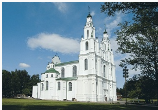
Софийский собор. 1738–50. Фундаменты и апсиды собора середины 11 в.

В Вел. Отеч. войну оккупирован герм. войсками 16.7.1941. Окрестности П. стали одним из центров партизанского движения в Белоруссии (т. н. Полоцко-Лепельская партизанская зона). В февр. 1942 герм. войсками уничтожено евр. гетто. Освобождён частями Красной Армии 4.7.1944 в ходе Полоцкой операции, составной части Белорусской операции 1944 . Во 2-й пол. 20 в. возникла осн. часть существующих ныне крупных пром. предприятий.