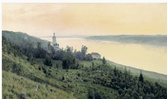
И. И. Левитан. «Вечер. Золотой Плёт». 1889. Третьяковская галерея (Москва).

В Смутное время П. – одно из мест сбора костромского ополчения. В 1609 разорён польско-литов. отрядами. В 17 в. развивался как торгово-ремесленный посад, фактически утратил статус города, центр Плёсского стана, к 1770-м гг. пригород Костромы. Важный центр транзитной торговли, в П. развивались ювелирное и кузнечное ремёсла, Заречье поставляло рыбу «на государев обиход». В 1666 упоминается как один из первых поволжских центров массового товарного произ-ва льняных тканей (работа закупочных контор гостя В. Г. Шорина). В 1708–78 входил в состав Московской губ. (с 1719 в её Костромскую пров.).