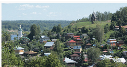
Плёс. Вид на Заречную (Рыбную) слободу и Воскресенскую церковь

Сохранившаяся гор. планировка сложилась в 17–18 вв. В 1781 утверждён первый регулярный план застройки П. Осн. улицы проложены параллельно Волге. На Соборной горе расположены: Успенский собор типа «восьмерик на четверике» (1699) с шатровой колокольней (кон. 18 в.), сев. корпус Присутственных мест (1786), гор. пейзажный парк (2-я пол. 19 в.). К северо-западу от быв. крепости – Прибрежная слобода с ансамблем Торговой пл.: 5-главая Воскресенская ц. (1817), торговые ряды и др. На быв. Воскресенской ул. (ныне ул. Ленина) – дерев. часовня Архангела Михаила (1825, перенесена в 1989 из с. Антоново Приволжского р-на). К югу от быв. крепости – быв. Троицкая слобода с комплексом 5-главой, преим. барочной, Троицкой ц. (1808) и небольшой зимней Введенской ц. (1828). В зап. части города – кладбищенская Преображенская ц. в стиле позднего классицизма (1840–49), дом отдыха «Плёс» (1924; дерев. корпуса с элементами модерна и др.).