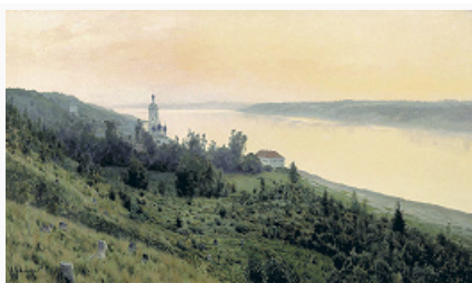
И. И. Левитан. «Вечер. Золотой Плёс». 1889. Третьяковская галерея (Москва).