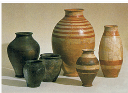
Керамические сосуды. 1 в. до н. э. Исторический музей (Базель).

В ЛТ C 2 (ок. 180/160–120) фибулы утрачивают «расчленённость», вырабатываются варианты В и С по Ю. Костшевскому, показательны типы Мёчвиль и Орнавассо, широко распространены проволочные с двумя восьмёрковидными петлями на спинке; стеклянные браслеты становятся неорнаментированными или с «волнистым» орнаментом; появляется керамика с примесью графита, с вертикальными расчёсами (бытовала до конца периода Л.). К концу среднего Л. исчезает стиль «красивых мечей», прекращается функционирование обширных кладбищ (в Центр. Европе появляются квадратные в плане рвы, заполненные остатками трупосожжений), начинается строительство оппидов .