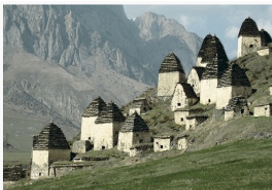
Даргавский «город мёртвых».

амцадис, галамбал), гостеприимства, побратимства, аталычества, кровной мести и выкупа. Выделялись феод. сословие (алдары, баделяты, царгасаты, гагуаты и др.; местами осет. феодалы выплачивали дань кабард. князьям, в Южной Осетии – груз. князьям), разл. категории крестьян; получило распространение домашнее рабство. Существовали экзогамные патронимич. группы и большие семьи (бинота) во главе со старшим мужчиной (хицау). Роды в прошлом имели свою тамгу (дамга). Практиковалась полигиния; за жену выплачивался выкуп (ирад), бытовало умыкание. Система терминов родства бифуркативно-линейного типа с преобладанием описат. конструкций. Сиблинги делятся по полу, а также на единокровных и единоутробных. Свадьбе предшествуют сватовство и сговор (фидыд). В день свадьбы устраиваются пиры в домах жениха (чындзхаст) и невесты (чызгарвыст). Невесту привозит и вводит в новый дом шафер (кухыл хацаг); при этом родным жениха подносится пирог (гуыдын) и др. дары, невеста угощает из особой чаши (мыдыкъус) свекровь и старших женщин смесью мёда и топлёного масла. Затем один из молодых соседей или родственников жениха (хуызисаг) снимает с невесты фату (хуызист) и трижды описывает над её головой круг особым белым флажком (сарызады хацъил), который затем хранят в потаённом месте. Жених видит невесту только на следующий день свадьбы.