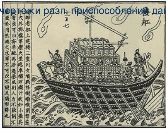
Китайская метательная машина, установленная на корабле. Изображение в трактате «Уцзин цзунъяо».

Чертежи разл. приспособлений даны в кит. трактате «Уцзин цзунъяо» («Важнейшее из основ военного дела»), опубликованном в 1044; возник даже особый жанр – «шоу чэн лу» («записки об обороне крепостей»), в которых описаны и способы преодоления укреплений. Эффективная дальность стрельбы камнемётов могла достигать 200 м при массе снаряда 60–80 кг; стреломёты (аркбаллисты) поражали цель на 500–600 м. Тангуты нередко размещали машины на повозках, обитых железными листами. Китайцы (не позднее 8 в.) и чжурчжэни использовали бамбуковые трубки