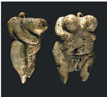
«Венера палеолита» из пещеры Холе-Фельс. Бивень мамонта. Ок. 35 тыс. лет назад (по Н. Конраду).

Вне территории Франции не выделены такие же дробные стадии О. К особенностям ранних памятников О. в Центр. и Вост. Европе относится наличие изогнутой формы у ориньякских пластин с выемками (т. к. выемки на противоположных краях располагаются не симметрично) и др. Затем такие пластины исчезают и осн. признаком остаются нуклеидные резцы и скребки, специфич. микропластинки (аналогичные О. IV и V на территории Франции).