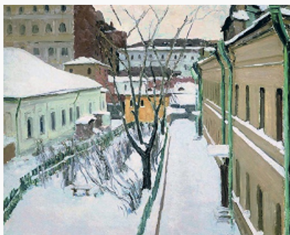
Общество московских художников.

И. Э. Грабарь. «Московский дворик». 1930. Русский музей (С.-Петербург).