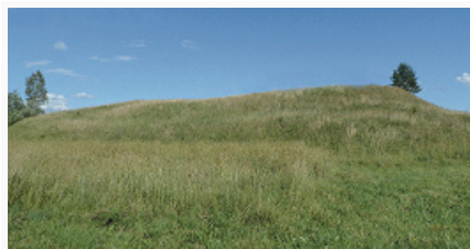
Городище Выбор в окрестностях Новоржева. Валы окольного города. Фото 2012.

Горевой). Музей истории Новоржевского края (1977; филиал Псковского гос. объединённого историко-архит. и худож. музея-заповедника). Завод по произ-ву кабельной продукции, маслозавод и др.