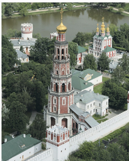
Новодевичий монастырь. Колокольня. 1683–90.

куполе – «Отечество», на сводах – Протоевангельский цикл, в люнетах – библейские сюжеты, на стенах в 3 ярусах – акафист и история Лиддской иконы Божией Матери, на столбах – святые. В 17 в. написан ряд новых композиций; фрески «починивались» (1666) и отмывались (1685), неоднократно поновлялись в 18–19 вв., были записаны масляной живописью (1759), в 1886–87 и 1901–1902 реставрированы Н. М. Сафоновым. С 1929 начаты исследования и науч. реставрация фресок. Высокий 5-ярусный иконостас, резной и позолоченный (1683–85; мастера Осип Андреев, Климентий Михайлов), сменил прежнюю алтарную преграду (фрагменты её росписи сохранились); старый состав его икон был при этом пополнен виднейшими мастерами Оружейной палаты (С. Ф. Ушаков , Н. Е. Павловец, Ф. Е. Зубов , Д. Е. Золотарёв и К. И. Золотарёв ). Сохранились также часть икон 16–17 вв., резная напрестольная сень (1653; К. Кондратьев) и решётка в сев. галерее, отделяющая придел Святых Прохора и Никанора.