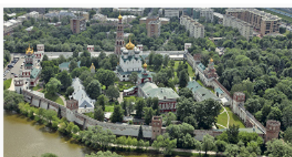
Новодевичий монастырь. Общий вид. Фото 2010.

НОВОДЕВИЧИЙ МОНАСТЫРЬ (Новодевичий Богородице-Смоленский женский монастырь), в Москве. Основан в 1524 вел. кн. Василием III Ивановичем в честь гл. святыни Смоленска – Смоленской иконы Божией Матери – по обету за взятие этого города (1514). Монастырь поставлен на скрещении сухопутных и водных дорог, идущих на запад от Москвы. Его огибала петля левого притока р. Москва (ручей Вавилон) и защищал обрывистый берег реки.