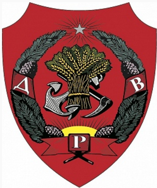
Герб Дальневосточной республики.

ДАЛЬНЕВОСТОЧНАЯ РЕСПУБЛИКА (ДВР), государство, существовавшее в 1920–22, на заключительном этапе Гражданской войны 1917–22 , на территории рос. Дальнего Востока и части Вост. Сибири. Создана решением ЦК РКП(б) как врем. гос. образование, которому внешне придавался демократич. характер. По замыслу это должно было предотвратить воен. конфликт между РККА и япон. войсками и способствовать выводу япон. войск с Дальнего Востока (находились там с 1918), что, в свою очередь, позволило бы ликвидировать последние формирования Белого движения . Для руководства новым государством ЦК