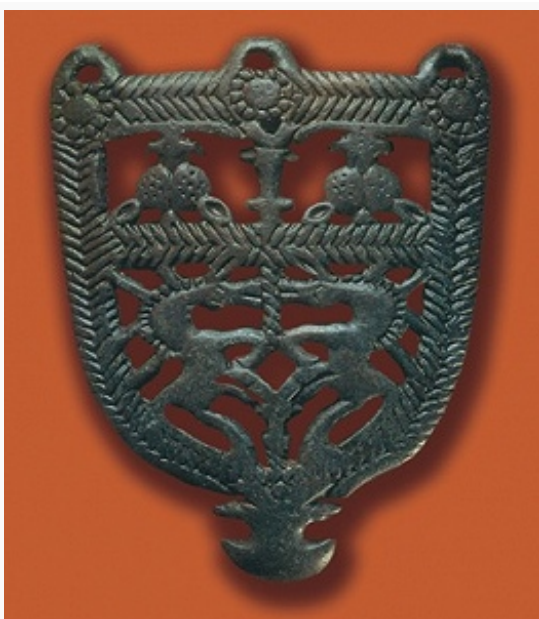
Пряжка. Бежтинский могильник.

влияния (приморская, присулакская, великентский комплекс , гинчинская культура ), на основе части из них складывается каякентско-харачоевская культура . Памятники рубежа бронзового и железного века относят к «северной» и «южной» культурным группам (зиндакская и мугерганская культуры по О. М. Давудову), традиции которых прослеживаются и позднее, наряду со свидетельствами тесных контактов со скифами. Предполагается, что через Д. проходил один из маршрутов походов скифов в Переднюю Азию. Обнаружено святилище раннего железного века (Хосрех). Известны многочисл. одновременные петроглифы и бронзовая антропоморфная пластика.