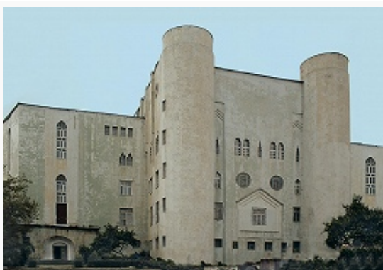
Махачкала. Дагестанская государственная сельскохозяйственная академия.

и деревянные детали, резные обрамления окон и дверей). Мечети в аулах (Калакорейш, Каракюре, Рича, все 11–13 вв.; Цахур, Кумух, 14 в.) – обычно прямоугольные в плане каменные сооружения с плоской крышей, опирающейся на резные деревянные столбы в интерьере; перед гл. фасадом – галерея. Минареты – круглые в плане (в аулах Рича, Мишлеш; оба 13 в.) или квадратные (в сёлах Шиназ, Рутул). Распространены каменные купольные мавзолеи (обычно квадратные в плане) с сомкнутым сводом (в ауле Дулдуг, 1682–83) или куполом (в ауле Хутхул, 1807–08), мосты (деревянные и каменные арочные), архитектурное оформление родников.