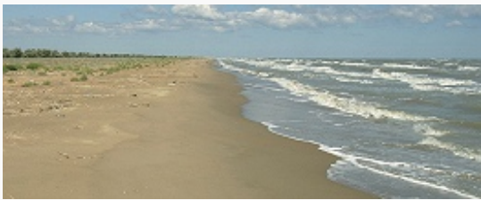
Побережье Каспийского моря.