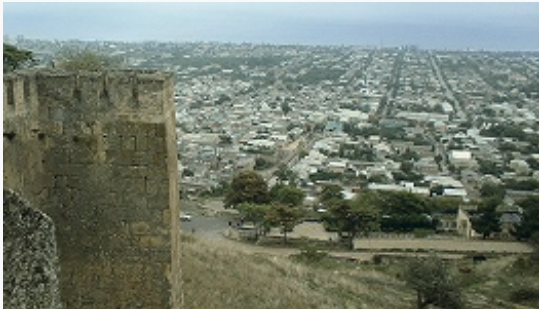
Вид Дербента с цитадели Нарин-Кала.