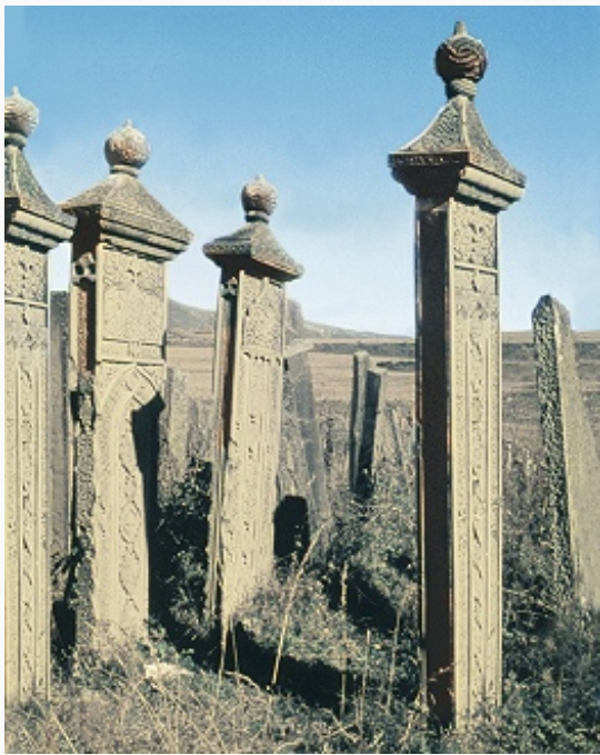
Надгробия в селе Уркарах.