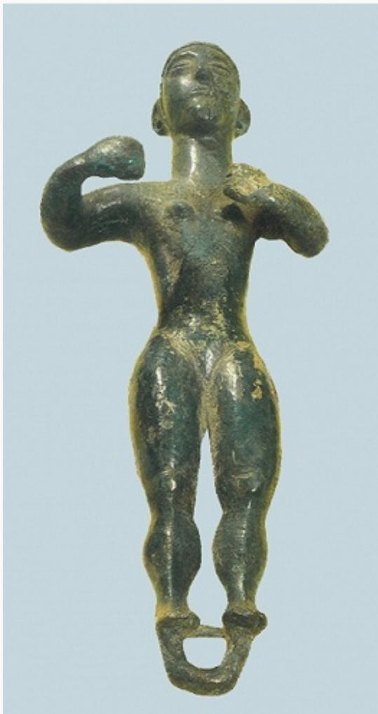
Статуэтка из культового места близ с. Согратль, Гунибский район. Бронза. 10–4 вв. до н. э. (по Д. Магомедову).