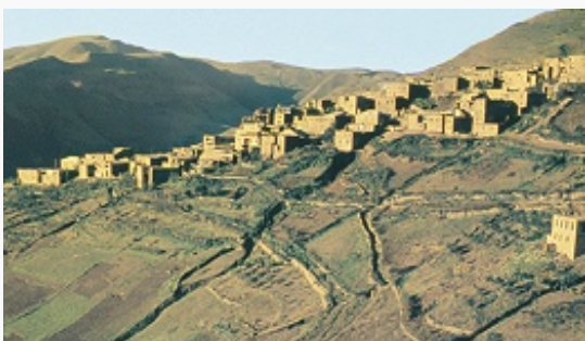
Посёлок Кубачи.

От раннего Средневековья сохранились руины гуннского г. Варачан (городище Урцеки близ г. Избербаш: оборонит. стены, бани, языческие храмы), хазарской столицы Семендер (близ с. Тарки). К 6 в. восходят каменные стены и крепости грандиозной (св. 40 км длиной) дербентской оборонит. системы, перегораживавшей прикаспийский проход – осн. караванный путь из юго-вост. Европы в Переднюю Азию. Связи со странами Востока оказали влияние на архитектуру Дербента, в которой прослеживаются чёткие стилевые периоды: оборонительное строительство 6 в. связано с сасанидским Ираном, архитектура 8–9 вв. – с арабо-мусульманской культурой (Джума-мечеть), 14–15 вв. – с влиянием Ширвана. О раннем проникновении