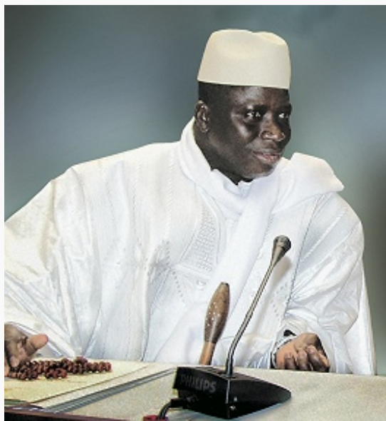
Президент Я. Джамме.

18.8.1965 Г. была провозглашена независимым гос-вом в составе Содружества. С 24.4.1970 в соответствии с новой конституцией она стала называться Республикой Г., пост президента занял Д. К. Джавара. В июле 1981 правительство Г. с помощью сенегальских войск подавило попытку гос. переворота. В 1982–89 страна входила в состав конфедерации Сенегамбия (гос. объединение Сенегала и Г. при сохранении ими собственных парламентов, правительств и финансовой самостоятельности).