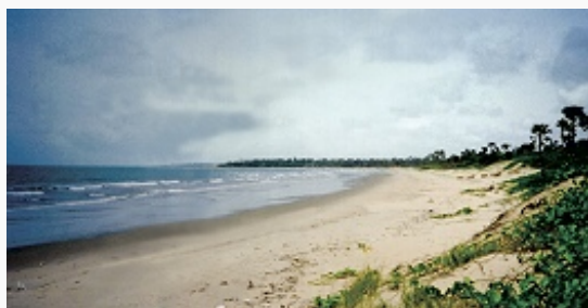
Атлантическое побережье Гамбии.

Территория Г. находится в пределах Сенегальского прогиба на зап. окраине Африканской платформы. В бассейне р. Гамбия на поверхность выходят глины, мергели и песчаники эоцена. В нижнем течении реки скважинами вскрыты мелководно-морские известняки, мергели и глины олигоцена –