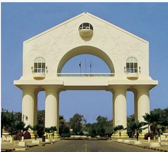
«Арка-22» в Банжуле. 1994. Установлена в ознаменование прихода к власти 22. 7.1994 Я. Джамме.