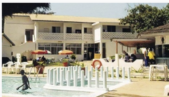
Отель в Бакау.

Г. полностью обеспечивает себя электроэнергией (произ-во 140 млн. кВт·ч, потребление 130,2 млн. кВт·ч; 2003). ТЭС в Банжуле, Басе-Санта-Су, Брикаме, Барре, Кау-Уре, Кунтауре, Джорджтауне, Юндуме.