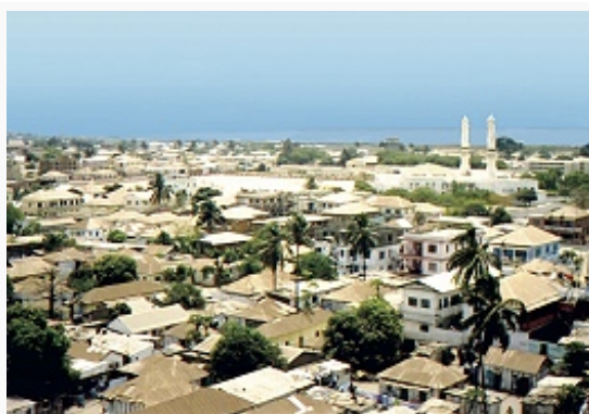
Банжул. Вид города.

Большинство населения Г. составляют народы, говорящие на манде языках (в т. ч. мандинка 38%, сонинке 7%, манинка 1%) и атлантических языках ( фульбе 18,8%, тукулёр 6,3%, волоф 12,6%, диола 4,4%, серер 2,2%, баланте 1,8%, баньюн 1,5%, манджак 1,4% и др.). Среди остальных – арабы- мавры (1,3%), а также небольшие группы хауса (0,4%), игбо (0,2%), йоруба (0,4%), креолов- аку (0,6%) и португалоязычных креолов (0,8%).